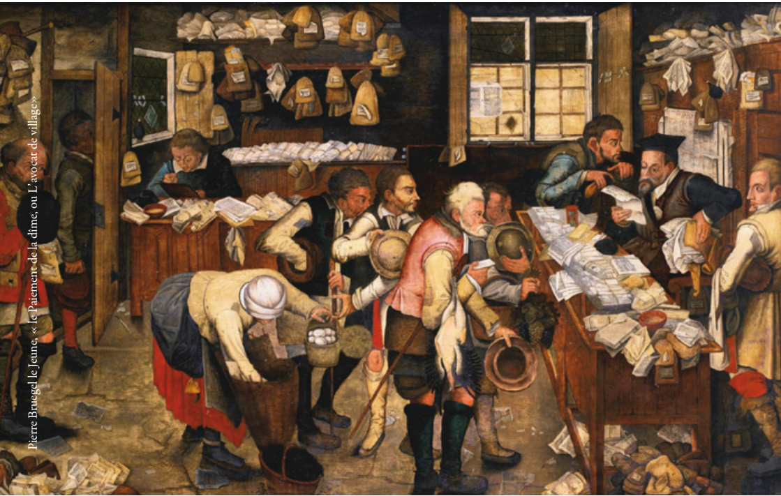
Pierre Bruegel le Jeune, « Le Paiement de la dime, ou L'avocat de village »

INSTITUT DU CHAMP FREUDIEN Sous l'égide du Département de Psychanalyse Université de Paris VII et de l'École de la Cause freudienne Association d'Utilité Publique