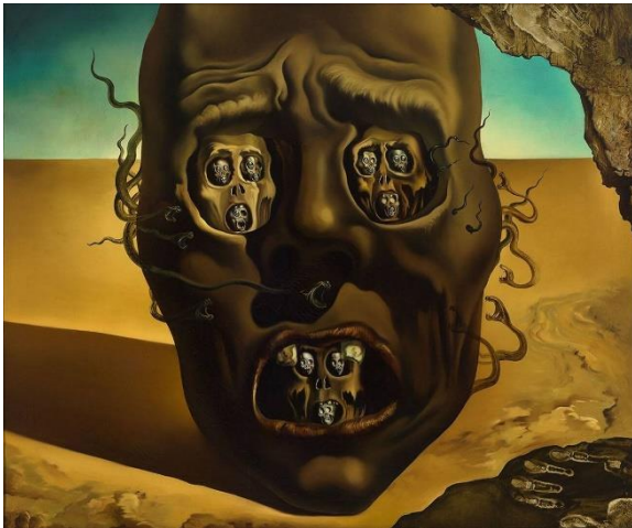
Salvador Dalí - Le visage de la guerre (1940)