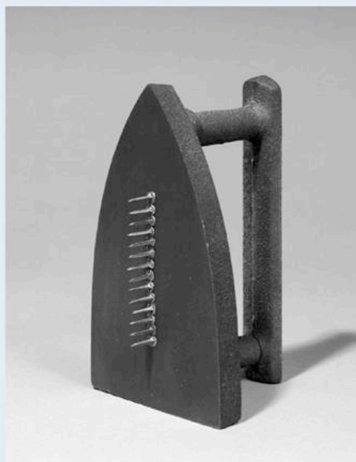
Man Ray, Codeau , 1921

Participation aux frais : 15 € et 8 € pour étudiants. Chèque (ordre Uforca) à envoyer à : UFORCA - 11, rue de la Bonneterie, 13002 Marseille. Gratuit pour les inscrits 2016 à la Section clinique, à la propédeutique et aux conférences d'introduction à Aix.